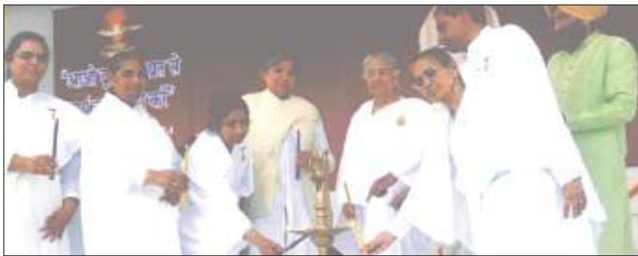
विश्व कल्याण सरोवर में आयोजित कार्यक्रम में मुख्य अतिथि व ब्रह्म कुमारी बहने दीप जलाकर कार्यक्रम की शुरुआत करते हुए।

8 -मुरथल में आओ दृढ़ता के व्रत से स्वयं का पोषण करें" शीर्षक से एक कार्यक्रम का आयोजन किया गया।